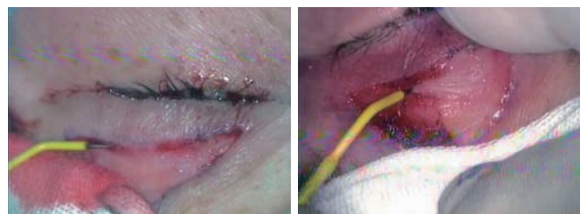
(図4) 止血処置ならびに眼輪筋切開

切開の動きは血管がある箇所は電極先をゆっくりと動かし組織への蓄熱量をコントロールしながら止血効果をもたせ剥離操作し瞼板を露出する。予め血管が露出している場合はエンパイアニードル電極を傾けた状態で組織に接触させ止血凝固モードにて止血処置を行うことで出血を減らす事が可能である。