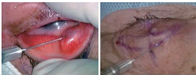
(図1) 瞼板結膜側と皮膚浸潤麻酔

麻酔方法はエピネフリン入りのキシロカインを用いて瞼板結膜側と皮膚浸潤麻酔。手術はすべて眼科手術用顕微鏡下で行った。尚、手術はすべてエンパイアニードルを使用した。