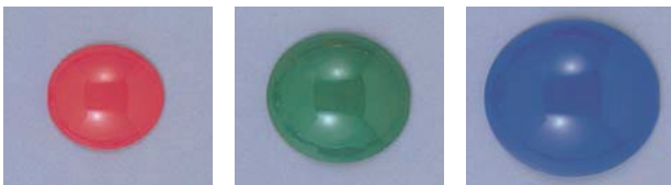
(図6) 角膜保護用プロテクター アイシールド H781

十分剥離できたら6-0ナイロンで瞼板に挙筋を前転させて縫合する。その後皮膚縫合を行う。抜糸はメスで切開した時より少し時間を長くして抜糸を行う。術後は2～3日眼瞼を冷やすようにしている。